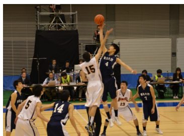
前回出場時の試合の様子