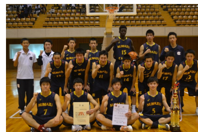
優勝したメンバー