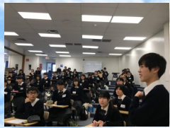
ロスアラミス高校