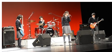
ピャンホウテン春ノパンマツリ

軽音楽部が12月22日(土)にグランシップで行われた第3回静岡県高等学校軽音楽新人大会に出場し、コピー曲部門において「ピャンホウテン春ノパンマツリ」が「優秀賞」を、「ひよこ」が「奨励賞」を受賞しました。この賞は優勝、準優勝に値する賞で、本校のバンドが上位2つの賞を独占しました。