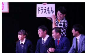
医療・福祉コース(3年)