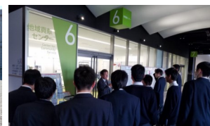
情報ビジネスコース(1年)