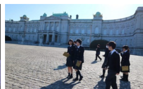
工芸デザインコース