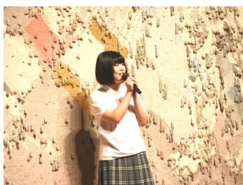
生徒会長による開会宣言

ステージの部は沼津市民文化センター大ホールで行われました。生徒会執行部のオープニングのあとに各HRの発表や吹奏楽部、軽音楽部、ダンス部の発表が行われ、特にダンス部によるダンスパフォーマンスは圧巻で、観客席を魅了しました。また、今年のファッションショー「NUMACHUガールズコレクション2018」も素晴らしい仕上がりでした。