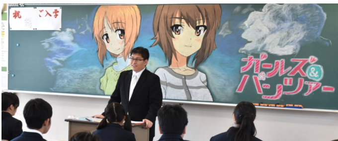
工芸デザインコースの生徒による新入生歓迎の黒板アート