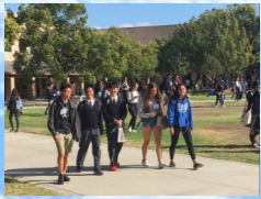
ボスコテック高校