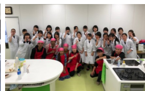
生活文化コース(1年)