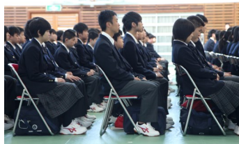
入学式に臨む新入生