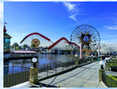
ディズニーパーク