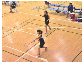
バドミントン部(女子)