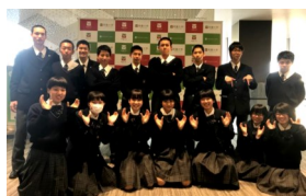
アドバンスコース(1年)

2年生が修学旅行の間、1・3年生は期末テストを実施しました。11月30日(金)には1・3年生が「コース研修」を行いました。コース研修は、コースごとにコースの特徴や特色に応じた研修を行います。アドバンスコースの1年生は「大学見学」、医療・福祉コースの3年生は「地域学習」、工芸デザインコースは「美術館の見学」、情報ビジネスコースの1年生は「大学見学」、生活文化コースの1年生は「異文化交流と調理体験」などを行いました。生徒たちは校外での学習でたくさんのお話を学ぶことができたのではないのでしょうか。また、医療・福祉コースの3年生が沼津ラウンよしもと劇場で受けた課外授業の様子が沼津朝日新聞(12月12日付)に掲載されました。